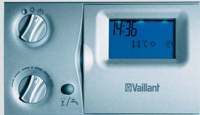
VRC 410 S

Weersafhankelijk regelsysteem met digitale zendergestuurde schakelklok. De cv-ketel reageert automatisch op de buitentemperatuur. In combinatie met thermostatische radiatorkranen het toppunt van comfort! Display met verlichting.