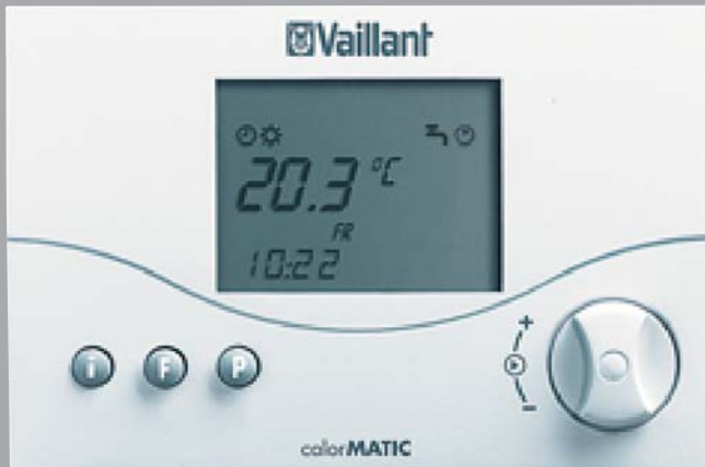
calorMATIC 240 / calorMATIC 330 / calorMATIC 340f / calorMATIC 360 / calorMATIC 360f / calorMATIC 400