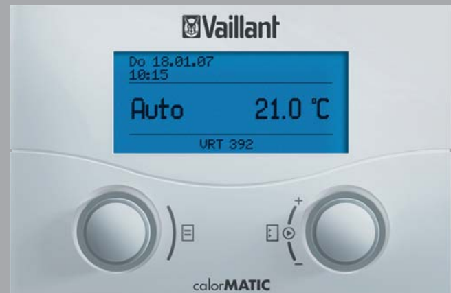
calorMATIC 392 / calorMATIC 392f / calorMATIC 430